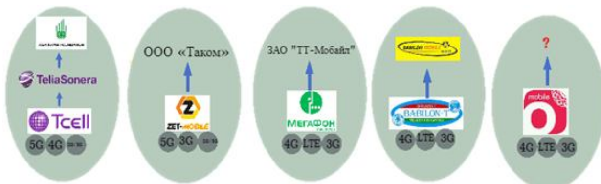
Расми 4. Ширкатҳои мобилии кишвар ва шабакаҳои роҳандозинамудаи онҳо

дошт. Ҳамин тариқ, саҳҳомони Русия бозорро тарк карданд ва оператор пурра моликияти ширкати маҳаллӣ гардид. Дар соли 2019 ребрендинг сурат гирифт ва оператор номи худро ба ZET-Mobile иваз кард.