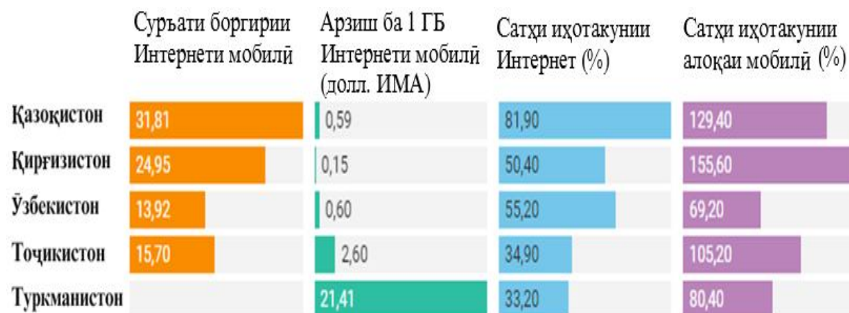
Расми 1. Суръат арзиши ва сатҳи иҳотаи Интернетии мобилӣ ва алоқаи мобилӣ дар Осиёи Марказӣ

Дар зер диаграммае пешниҳод карда шудааст, ки интернетии мобилӣ ва алоқаи мобилӣ дар Осиёи Марказиро аз рӯи додаҳо, барои соли 2021 таҳқиқ карда, он дар худ чунин бандҳоро мисоли суръати боргирии интернетии мобилӣ (Мбит/с), арзиш барои 1 ГБ интернетии мобилӣ (доллари ИМА), сатҳи воридшавии Интернет (%), сатҳи воридшавии алоқаи мобилӣ (%) -ро дар бар гирифта аст.